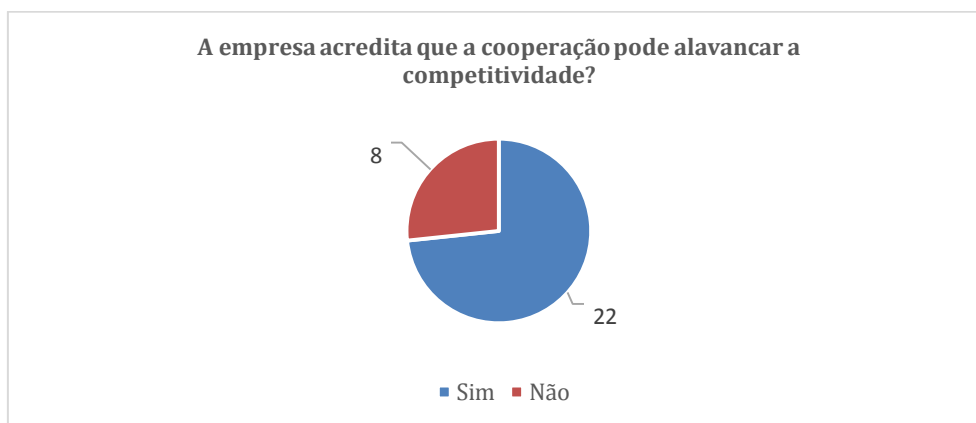
Figura 2 - Número de empresas que acreditam na cooperação como mecanismo de alavancagem da produtividade

Inicialmente, foi possível observar, como demonstrado na figura 2, que um percentual significativo das empresas (73,3%) acredita que a adoção de práticas cooperativas pode alavancar a sua competitividade. Já a figura 3 mostra que a maioria, ainda que não significativa, das empresas (53,3%) encontra-se aberta a participar de programas baseados em redes de cooperação desenvolvidos e coordenados por Organizações de Suporte.