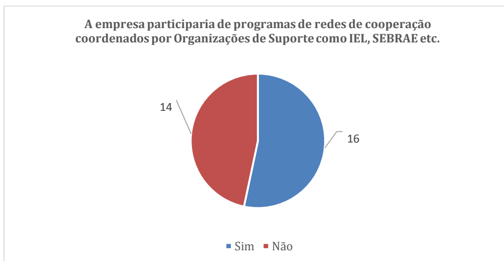
Figura 3 - Número de empresas que participariam de programas de redes de cooperação coordenados por Organizações de Suporte